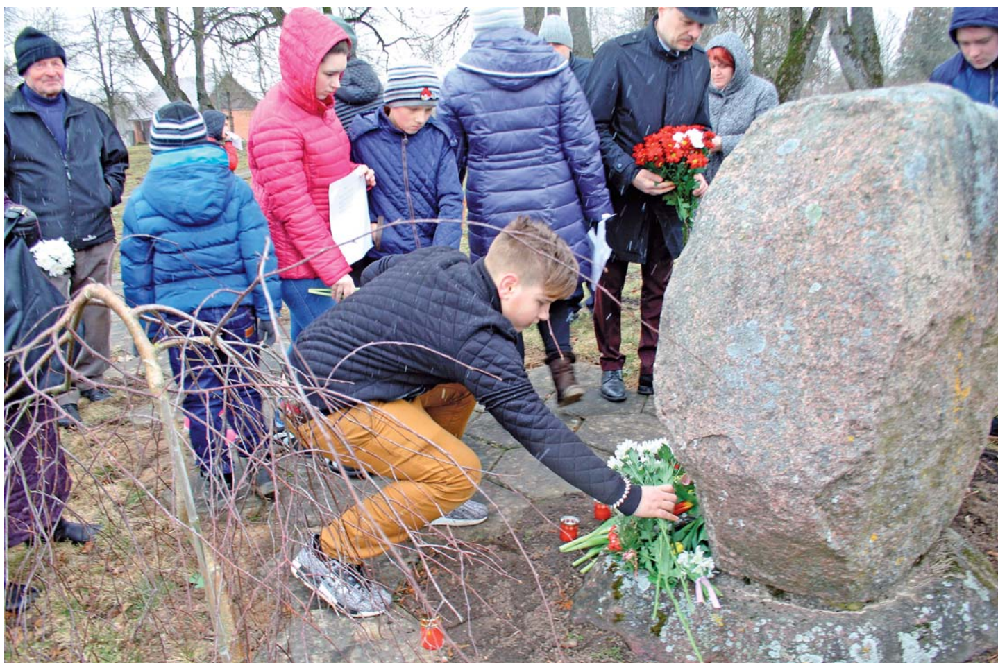
25.marts- pieminam, lai neaizmirstu...